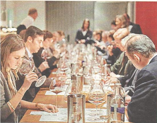
Konzentrierte Kompetenz 20 Juroren vergaben im Finale Punkte. Die Experten wussten nicht, von welchen Produzenten die Weine stammten, die sie vor sich hatten